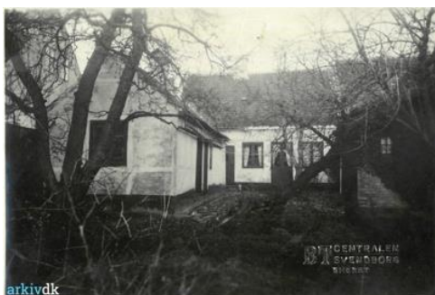
Haven Skattergade 8 i 1920/30.