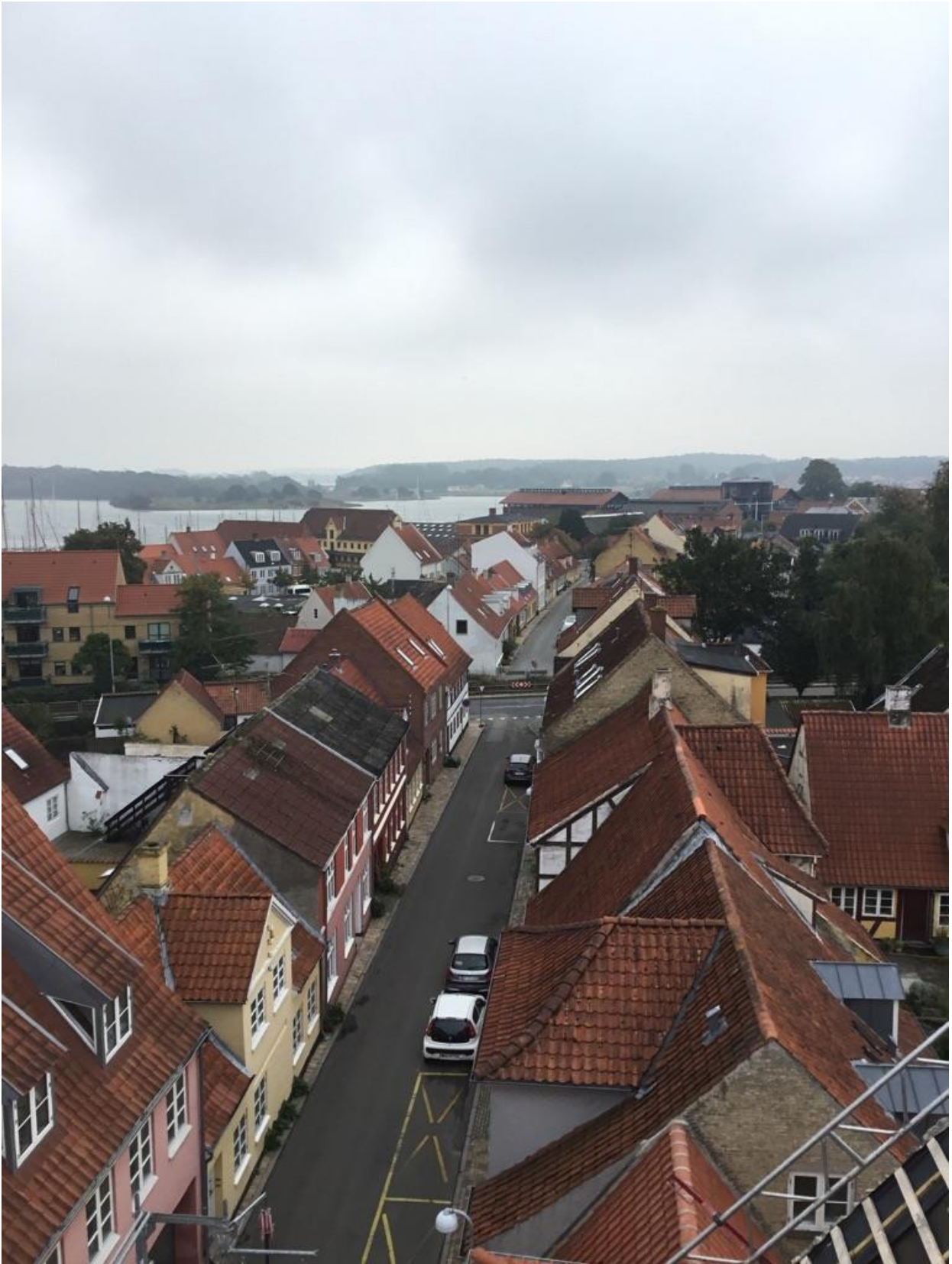
Skattergade i 2019.